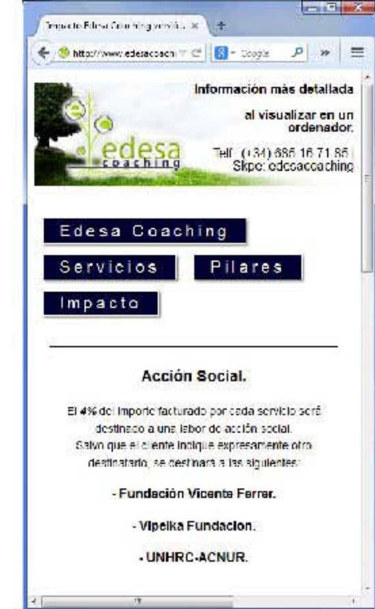
Visualización en un area de smartphome

Se discriminaba el dispositivo mediante un media query muy sencillo del tamaño de dispositivo. HTML5 y CSS3 estaban comenzando en 2011 y aún no estaba desarrollado el termino "responsive". En la versión móvil el texto se veía plano sin imagen alguna, solo texto y enlaces para quitar peso.